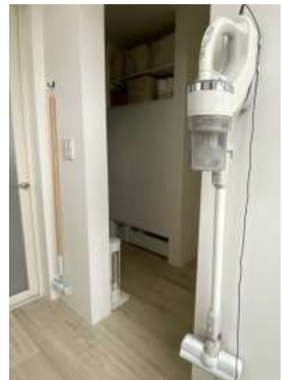
リビングで使用する 掃除用具の定位置化