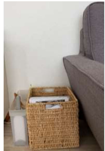
ソファ横に夫のスペース 「投げ込み BOX」

私自身の事例になりますが、夫がよくいるソファ横に夫のスペース＝「投げ込み BOX」設置とそのスペースの大きさについて話し合っただけによって、夫自身で整理・管理するようになりました。また、よく見える位置にリビングで使う掃除用具を置き、定位置もコミュニケーションをとりながら情報共有したことでお互いが気づいた時にさっと掃除できる習慣に変わりました。