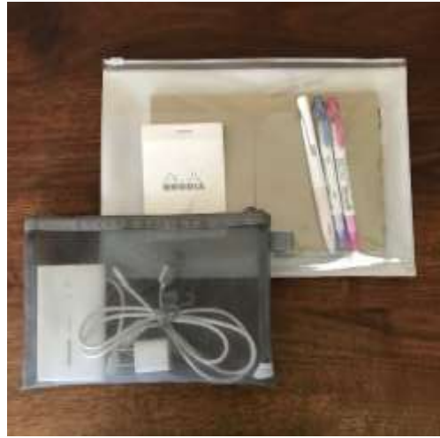
バックインバックとしてのポーチ活用例