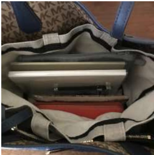
トートバックでのバックインバックの例

バッグの中をすっきり使うおすすめグッズは、メッシュポーチ、小さいトートバッグ、仕切り代わりに使えるクリアファイルです。市販のものではなくても、100円ショップや雑誌の付録のバッグなど家にあるもので工夫できます。ぜひ、おうちでバックの中を整理してみてください。