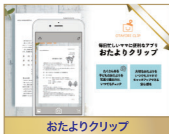
おたよりクリップ